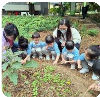
低班參觀 綠匯學院