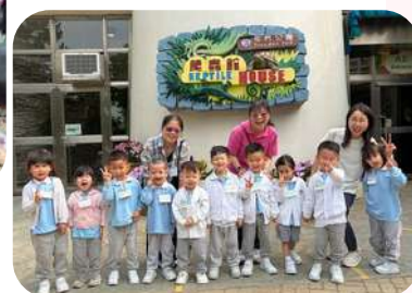
幼兒班參觀 屯門爬蟲館