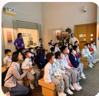
高班參觀 香港文化博物館