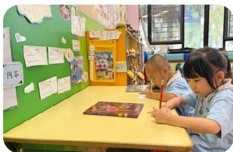
自選活動 - 閱讀角