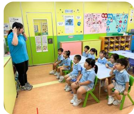
又到了主題時間， 準備聽故事！