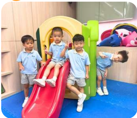
與好朋友一起進行體能遊戲！