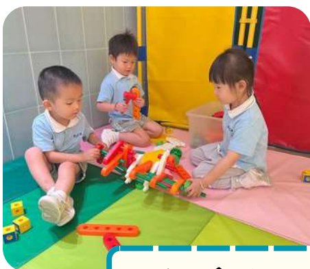
我們會拼砌出不同的東西！