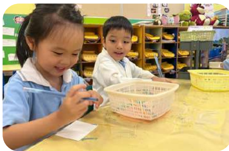
自選活動 - 圖工角