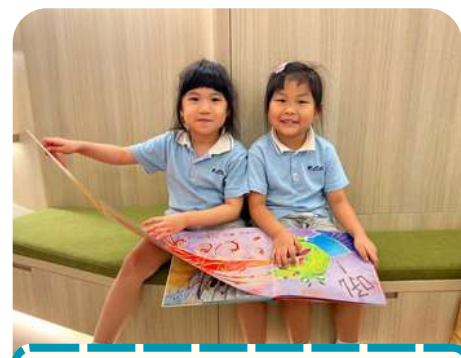
來聽我們說故事吧！