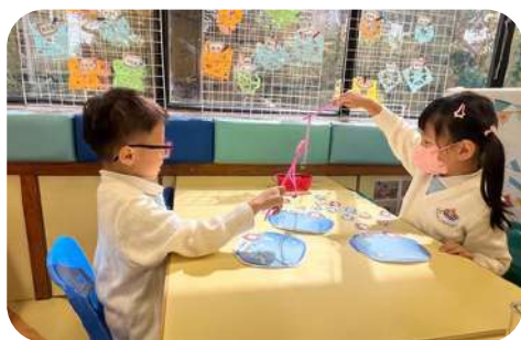
自選活動 - 教材角