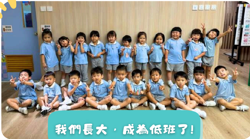
我們長大，成為低班了！