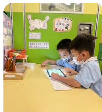
自選活動 - 探索角