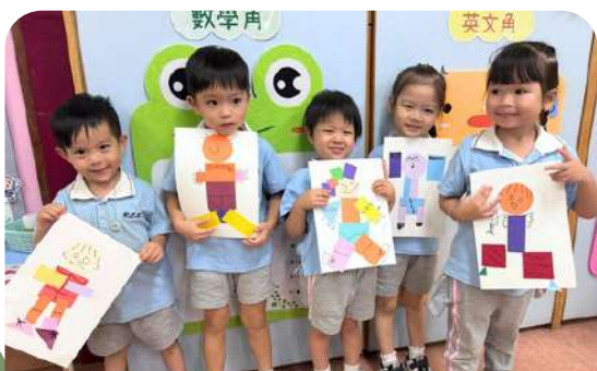
這是我們的「自畫像」！