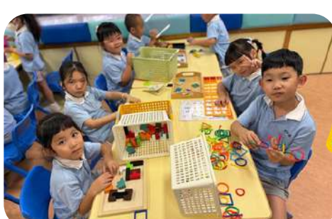
自選活動 - 桌玩角