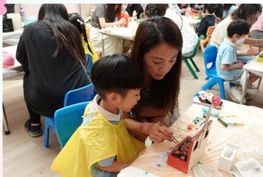
Happy Mother's Day