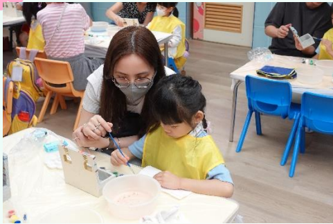
Happy Mother's Day