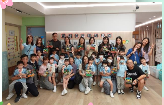
Happy Mother's Day