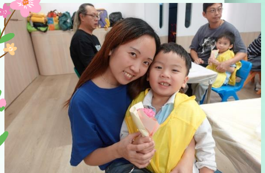
Happy Mother's Day