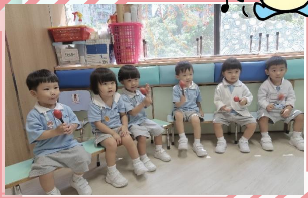
沙槌的聲音真有趣！