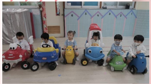
我們準備好出發了！