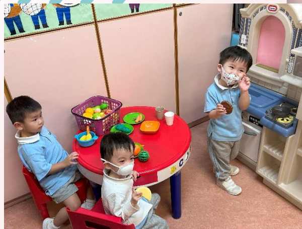
在幻想角中扮演廚師及客人。