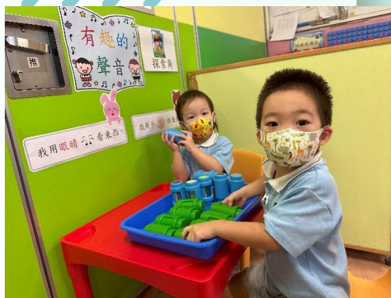
同學在探索角運用感官進行探索。