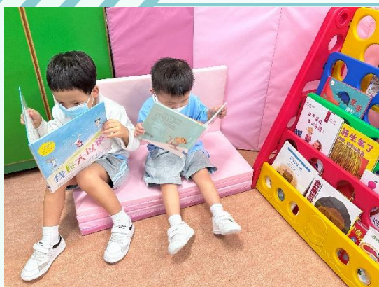
同學到圖書角看圖書。

幼兒班分為西瓜組及菠蘿組。每天按自己的興趣入不同角落，幻想角、圖書角、圖工角、探索角、小肌肉角和教材角進行活動，體驗群體生活的樂趣，在愉快的環境下成長！