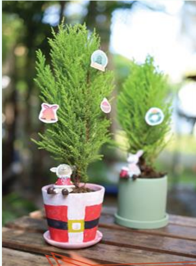
12月聖誕親子慶祝活動 《聖誕 Tree - Tree》