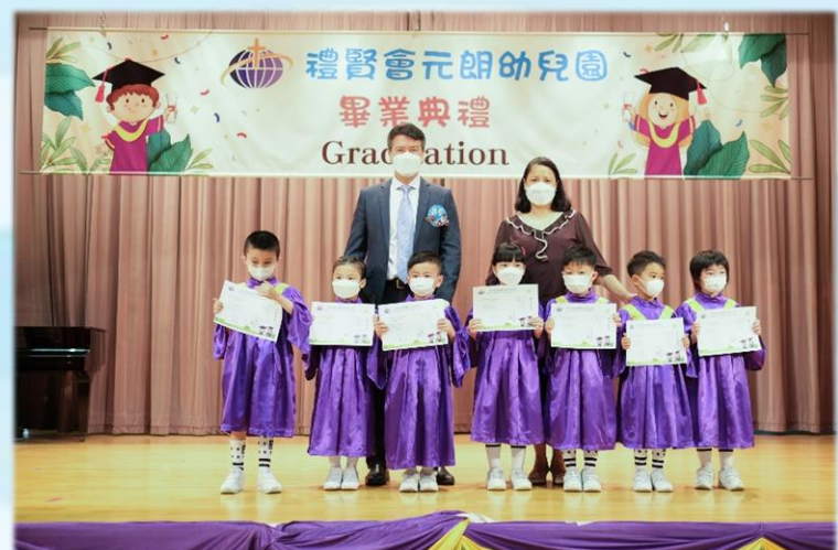
邀請羅校長與嘉賓胡副校長為畢業生授憑