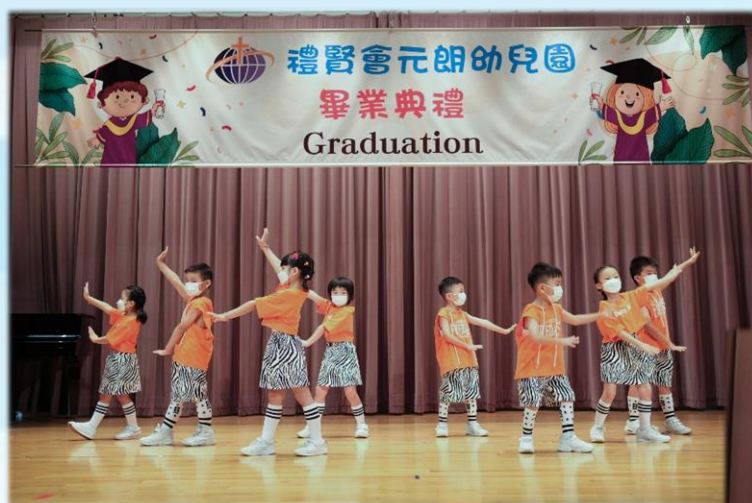
畢業生為我們表演跳舞