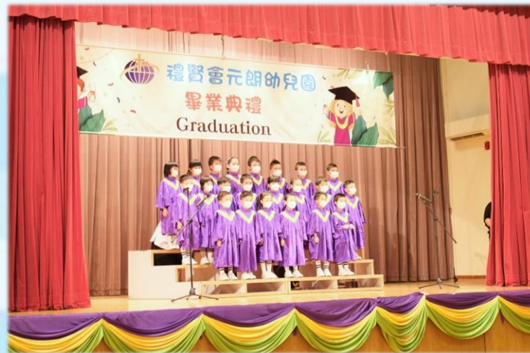
畢業生為我們獻唱歌曲

高班畢業典禮已經完滿結束，祝願本年度畢業生前程錦繡，主恩滿溢。現在我們一起回顧當天精彩的活動花絮！