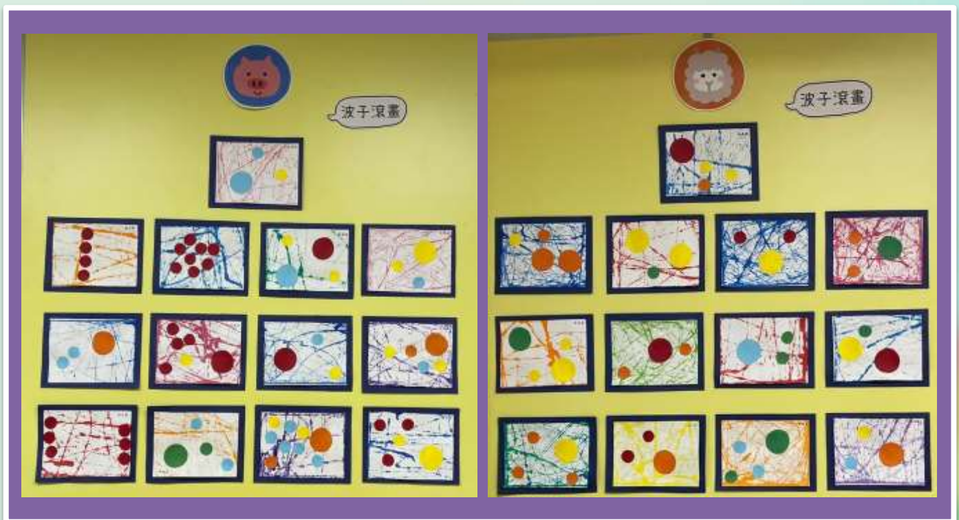
幼兒班—藝術活動（波子滾畫）